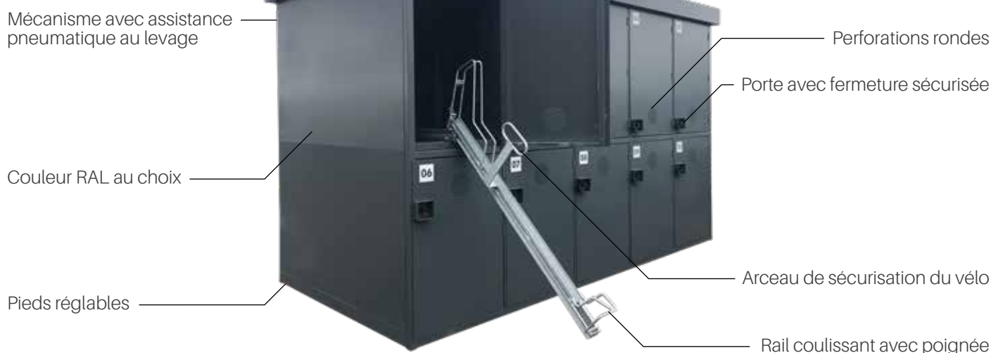
Schéma légendé :