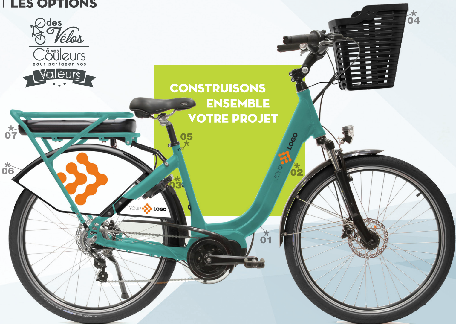
01/02 Peinture et marquage Personnalisés