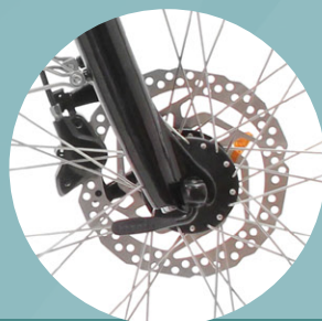
Freins à disque hydraulique

Autonomie Vitesse Compteur total Compteur journalier Mode sélectionné Allumage des feux automatique