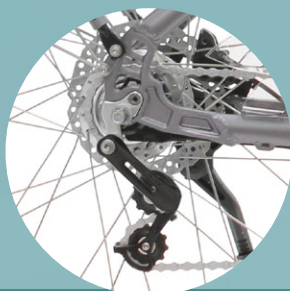
Moyeu 5 Vitesses intégrées Sturmey Archer + Tendeur